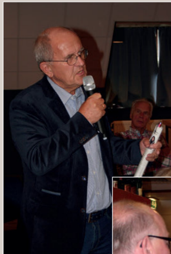
Kritische vragenstellers achter de microfoon

Ten opzichte van andere fondsen doet PNO Media het steeds beter. Dat komt voor een deel door de betrekkelijk geringe rente-afdekking die het bestuur hanteert. Daardoor loopt PNO Media in op de grotere fondsen. Van de hele grote fondsen heeft nu alleen het fonds van de Bouwnijverheid een hogere dekkingsgraad.