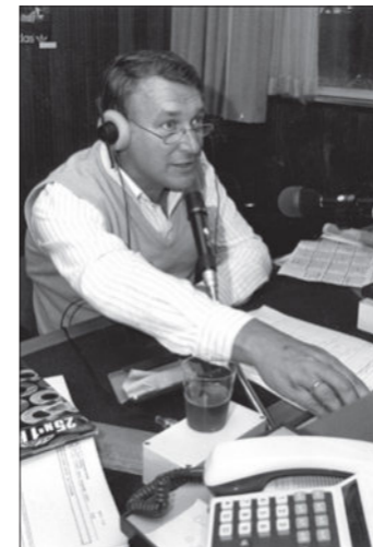
Presentatie Met het Oog op Morgen