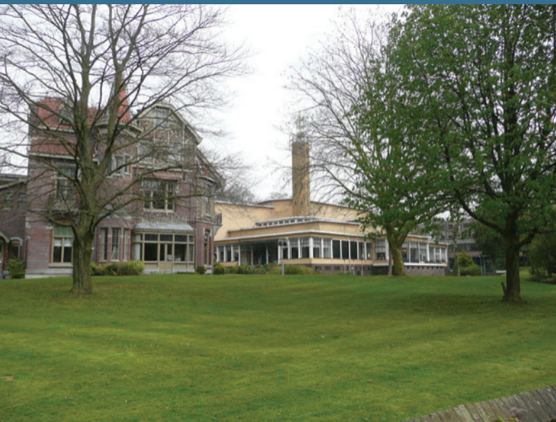
NCRV-studiogebouw aan de Schuttersweg, Hilversum