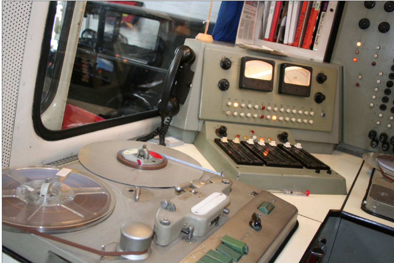
Boven en onder: Interieur reportage- wagen.

die de Arbeidsinspectie vandaag niet meer zou toestaan. Mensen hadden daar last van, maar de apparatuur bleef gewoon dienst doen. De transistor bestond nog niet. De wagen met zijn inbouw-stroomvreters kon op externe elektriciteit werken, maar had ook accu's aan boord om vier uur lang 'midden op de hei' te kunnen opnemen en uitzenden. "Omroepen uit heel Euro-