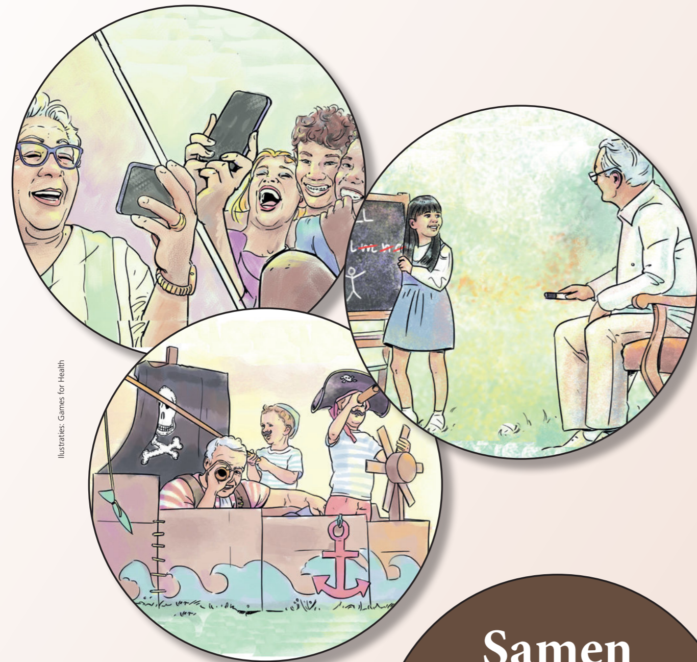
Illustraties: Games for Health